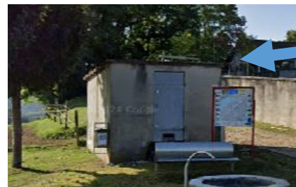
Photo de l'emplacement au cimetière