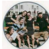
La meilleure troupe Jeunesse d'Essertines-sur-Yverdon Dans « Au pays de Candice »