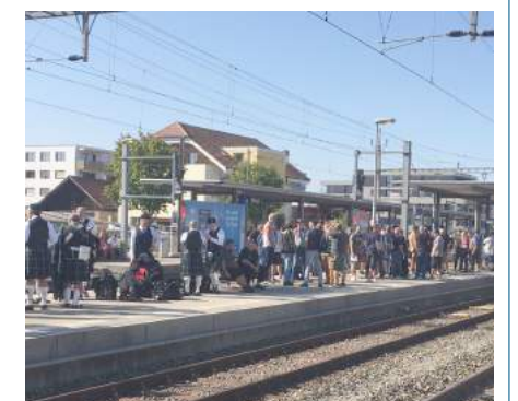
Départ de Morat où un grand nombre de passagers attendaient le fameux train.

L'organisateur - The Single Malt Shop à Morat